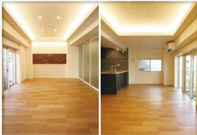
●現地写真(令和4年5月21日撮影)